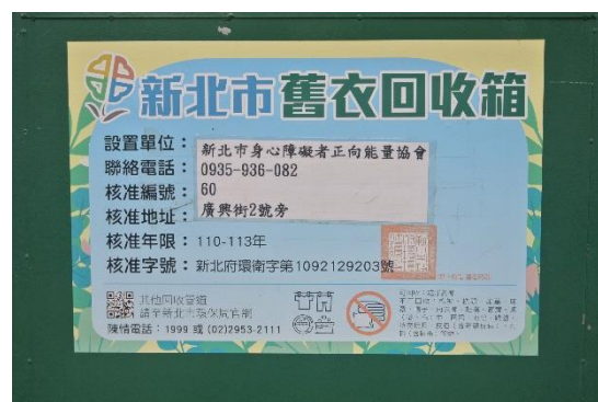
圖 3 環保單位核准標示