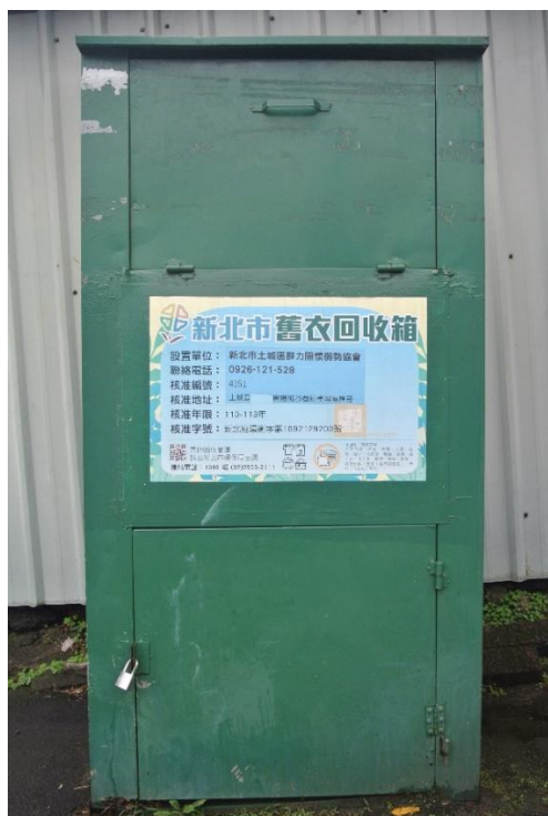
圖 2 合法舊衣回收箱